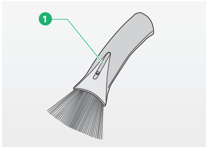
Bild 2 Die Softdüse ausgeschoben