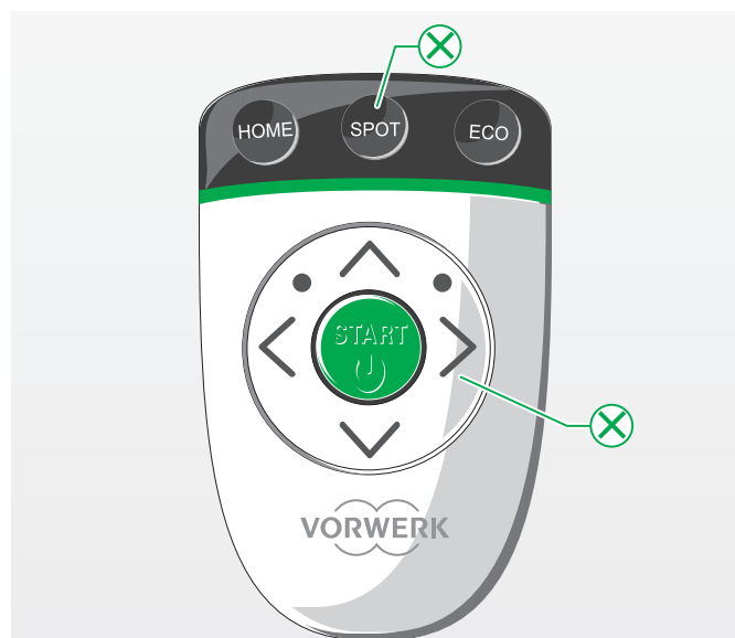
Die mit markierten Tasten sind im normalen Reinigungsmodus nicht verfügbar

In den verschiedenen Reinigungsmodi sind nicht immer alle Tasten der Fernbedienung für die Steuerung des Saugroboters verfügbar.